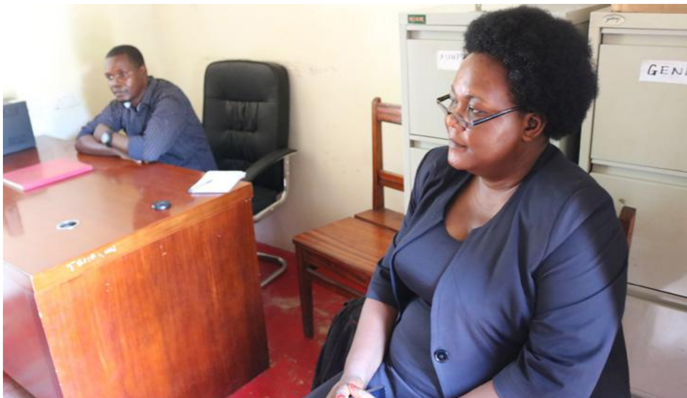
Baadhi ya Watumishi wa TSC Bagamoyo wakiwa ofisini kwao.

Ofisi ya TSC Bagamoyo inahudumia halmashauri mbili za Bagamoyo na Chalinze zikiwa na jumla ya shule 176; Bagamoyo shule 46 ikiwa ni 36 za Msingi na 10 za Sekondari huku Chalinze ikiwa na shule 128 ambazo 108 niza Msingi na 20 za Sekondari.