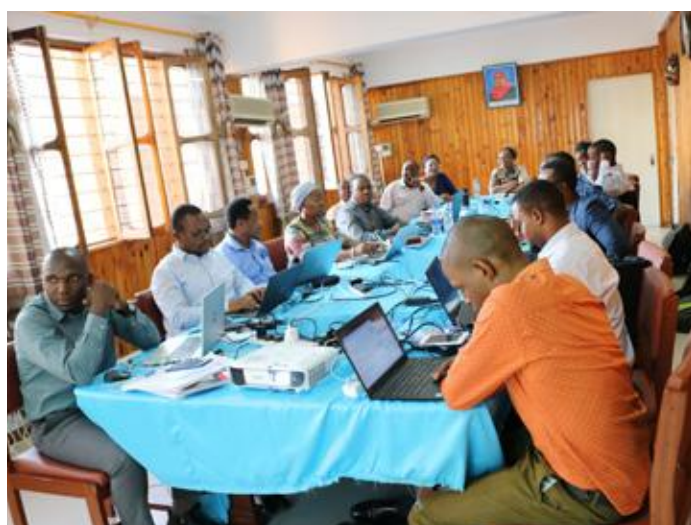
Kikosi kazi maalaum cha kuhakiki taarifa za Walimu wa Shule za Msingi na Sekondari za Serikali Nchi nzima kikiwa kinaendela na kazi baada ya taarifa hizo kuwasilishwa na ofisi za TSC ngazi ya Wilaya.