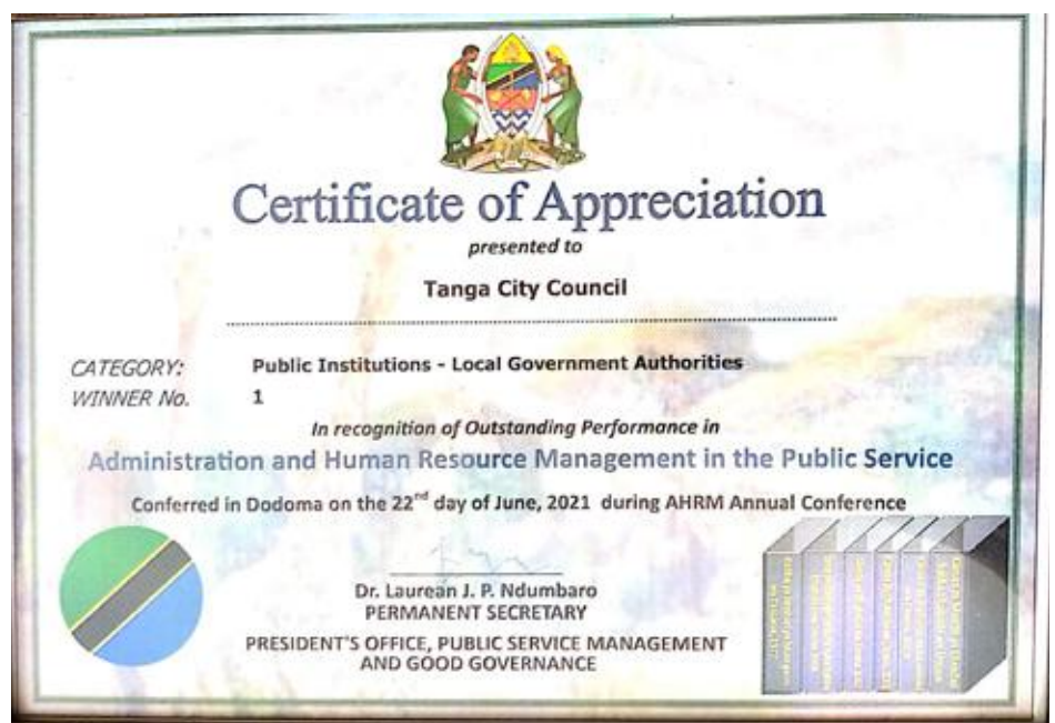
Cheti cha pongezi kilichotolewa kwa Halmashauri ya Jiji Tanga.

Hivyo, alimuomba Katibu wa TSC kuona namna anavyoweza kuisaidia ofisi hiyo katika suala la usafiri ili iweze kuendelea kutoa huduma kwa walimu katika ubora unohitajika.