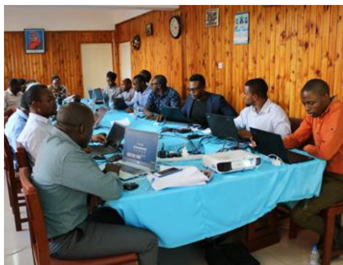
Kikosi kazi maalaum cha kuhakiki taarifa za Walimu wa Shule za Msingi na Sekondari za Serikali Nchi nzima kikiwa kinaendela na kazi baada ya taarifa hizo kuwasilishwa na ofisi za TSC ngazi ya Wilaya.