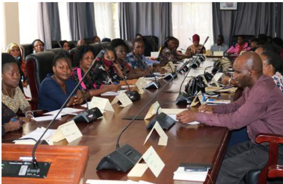
Baadhi ya watumishi wa Kada Saidizi wakiwa katika ukumbi wa mafunzo.

Changamoto nyingine Tume hiyo kwa ujumla. iliobainishwa na kiongozi "Tumegundua wapo baadhi huyo ni baadhi ya watumishi yenu ambao wanatoa siri za wanauhusika katika kupokea na ofisi kitu ambacho wote mnajua kusambaza barua kutoziwasilisha kuwa ni kinyume na taratibu za sehemu zinapotakiwa kufika kwa kazi. Baadhi yenu mnaletewa wakati kitu ambacho kinaathiri barua lakini hamzigongi mhuri